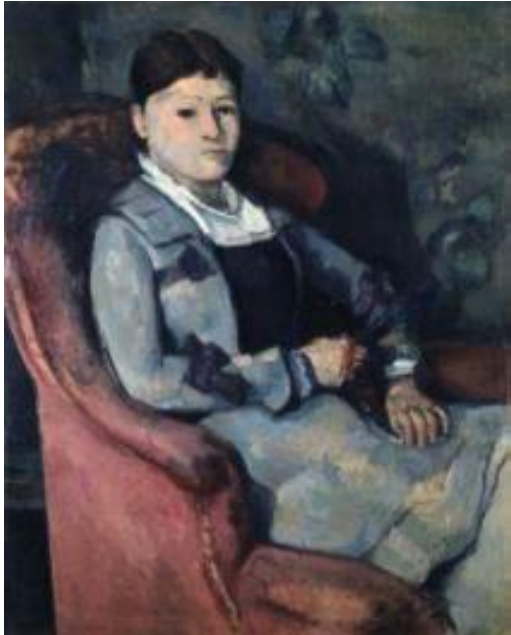
Madame Cézanne à l'éventail , vers 1878-1888 H.T. 92 x 73 cm Fondation Collection E.G. Bührle, Zurich