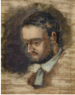
Portrait d'Emile Zola, vers 1862-1864 Huile sur toile, 26 x 21 cm Musée Granet Aix-en-Provence