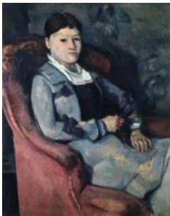
Madame Cézanne à l'éventail , vers 1878-1888 Huile sur toile 92 x 73 cm Fondation Collection E.G. Bührle, Zurich