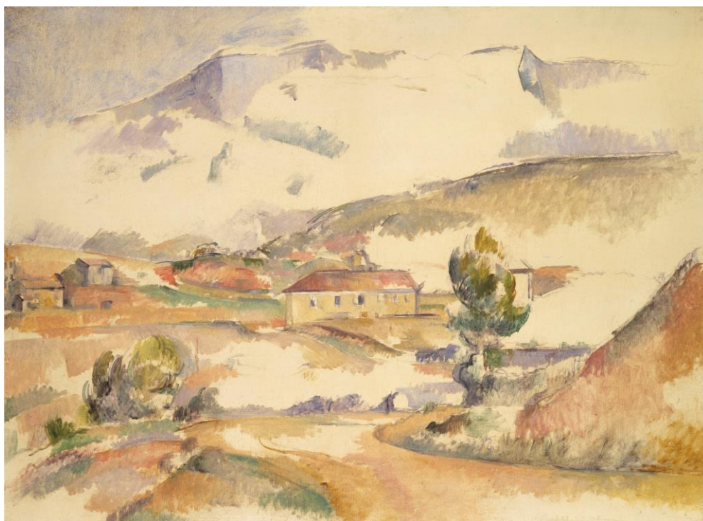
La Montagne Sainte-Victoire vue du Pont de Bayeux à Meyreuil , vers 1887 H.T. 67.5 x 91.5 cm - National Gallery of Art, Washington

Le Cabanon de Jourdan exécuté en août 1906 est son dernier paysage connu.