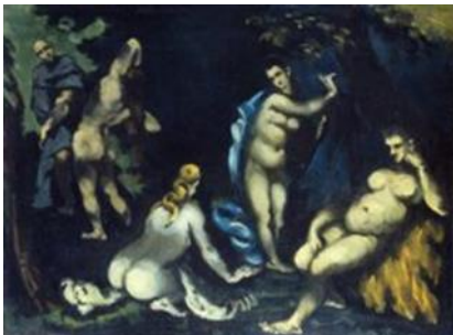
La Tentation de St-Antoine , vers 1870 Huile sur toile, 57 x 76 cm Fondation Collection E.G. Bührle, Zurich