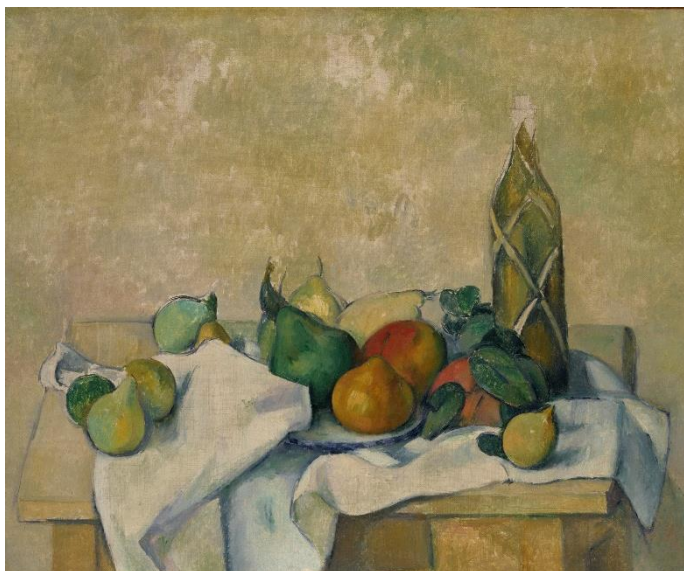
Bouteille de liqueur , vers 1890 H. T. 54.2 x 65.5 cm - Pola Museum of Art, Japon

Parmi les œuvres issues de cette période datent de nombreux paysages solaires de Provence. L'Allée du Jas de Bouffan (1890), La Maison de Bellevue vers 1890, La Bouteille de liqueur (vers 1890) témoignent de ce Cézanne novateur où il défie la perspective classique, schématise ses sujets, dans un synthétisme très moderniste.