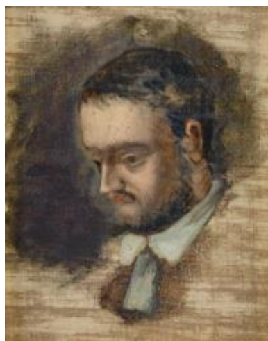
Portrait d'Emile Zola , vers 1862-1864 H.T. 26 x 21 cm Musée Granet - Aix-en-Provence