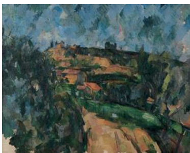
La route tournante en haut du chemin des Lauves , 1904-1906