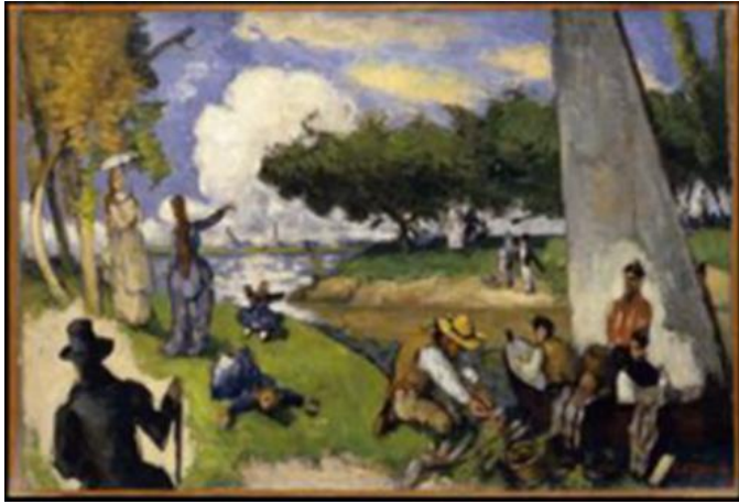
Les Pêcheurs – Journée de juillet , vers 1875 H.T. 54,5 x 81,5 cm The Metropolitan Museum of Art, New York