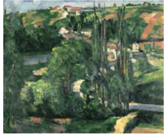
La côte de Jalais à Pontoise , 1879-1881 H.T. 60 x 73 cm Fondation Louis Vuitton, Paris

Dans cette veine marquée par l'impressionnisme (Cézanne participera à la première exposition du groupe en 1874 et à la troisième en 1877), ses thèmes évoluent dans leur facture.