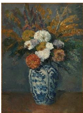
Dalhias dans un grand vase de Delft , 1873