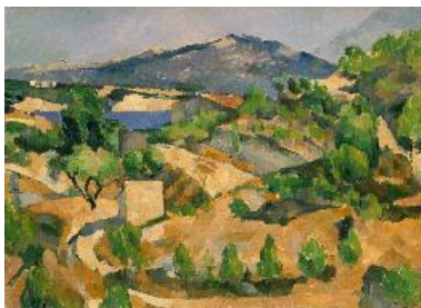
Montagnes en Provence (Le Barrage de François Zola) , vers 1879

Huile sur toile, 73,5 x 93 cm Palais Princier, Monaco