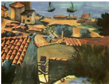
Le Village des pêcheurs à l'Estaque , 1867-1869 (1870)

Huile sur toile, 42 x 55 cm © Philadelphia Museum of Art Philadelphia, Promised gift from a private collector