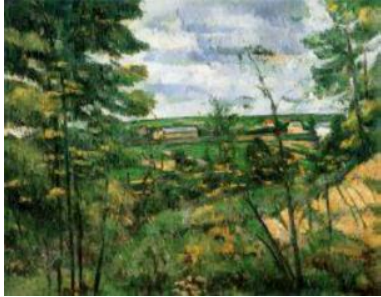
La Plaine de Saint-Ouen-l'Aumône vue prise des carrières du Chou , vers 1880