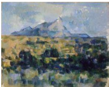
La Montagne Sainte-Victoire vue des Lauves , 1902-1906