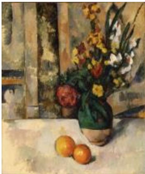
Le Vase de fleurs et pommes , 1889-1890 H.T. 56 x 46.5 cm Collection particulière

De motifs simples tirés du quotidien - un linge blanc ou une étoffe multicolore, une sélection de fruits ou de fleurs - Cézanne compose ses natures mortes dont la puissance de la lumière souligne, entre 1880 et 1890, le dépassement de l'impressionnisme et sa liberté conquise dans sa touche et sa perception.