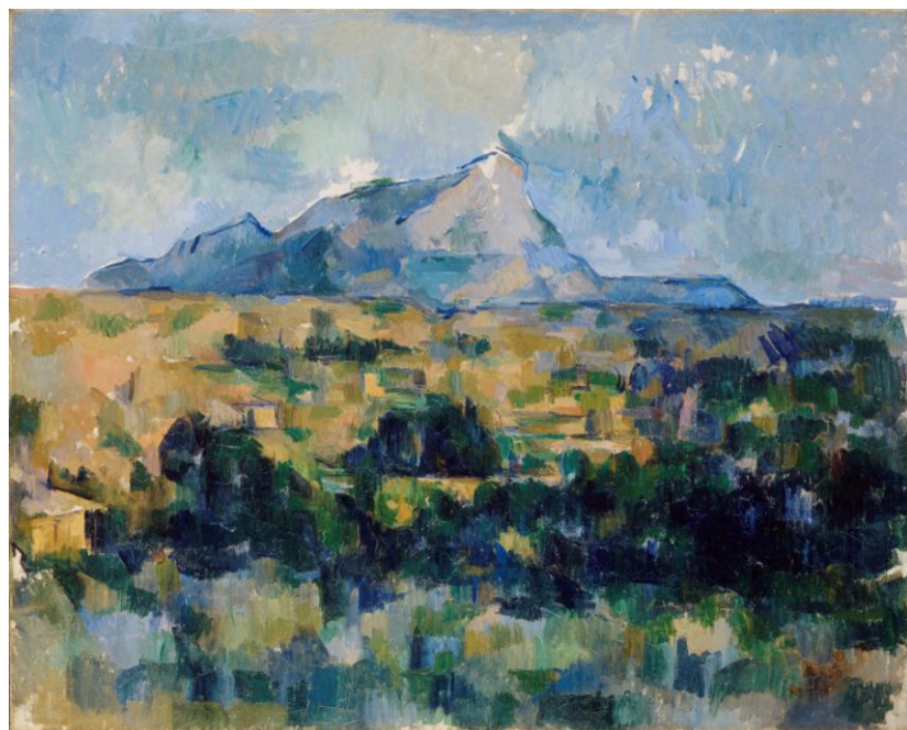
La Montagne Sainte-Victoire vue des Lauves , 1902-1906 H.T. 65 x 81 cm - collection particulière

Grand marcheur devant l'éternel, le maître connaît parfaitement les reliefs, les accidents et la géologie de sa terre natale où la montagne Sainte-Victoire domine les panoramas. Je vais au paysage tous les jours, les motifs sont beaux et je passe ainsi mes jours plus agréablement qu'autre part... écrit-il.