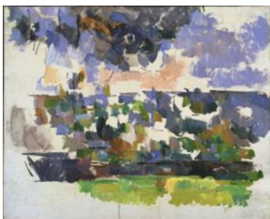
Le jardin des Lauves , vers 1906