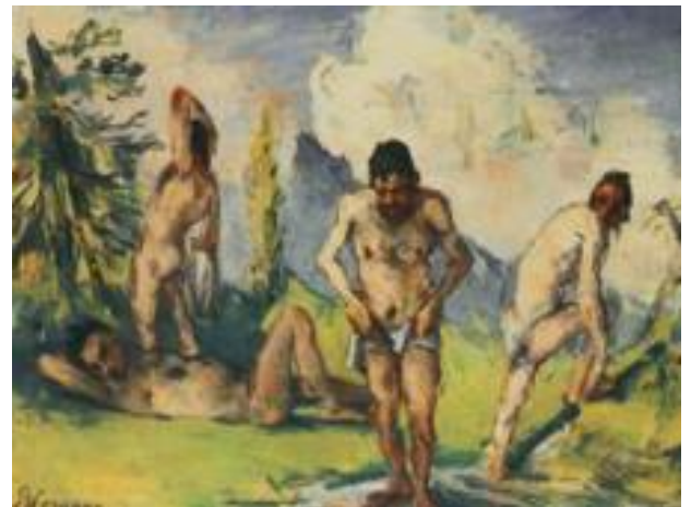
Les Baigneurs au repos , vers 1875-1876 H.T. 38 x 45.8 cm Musée d'art et d'histoire de Genève