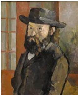
Autoportrait au chapeau , 1879 Huile sur toile, 60 x 50 Kunstmuseum Berne