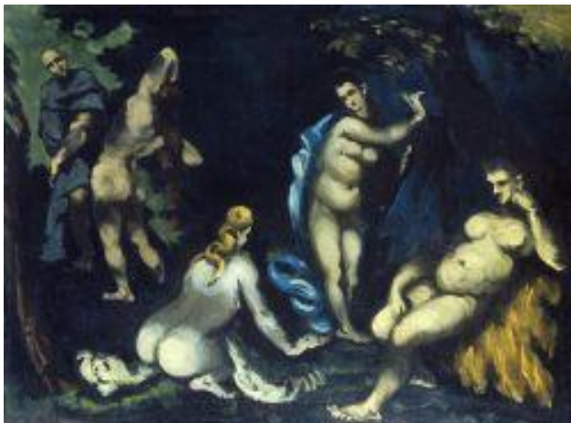
La Tentation de Saint-Antoine , vers 1870 H.T. 57 x 76 cm Fondation Collection E.G. Bührle, Zurich

Parmi les variations qu'il entame, La Tentation de Saint-Antoine (1875-1877), campée dans la Provence rocailleuse, s'éloigne des compositions historiques formelles pour installer quelques corps dénudés. Plus naturaliste, Les Baigneurs au repos (1875-1876), surpris dans leur récréation en plein air, évoquent les nouveaux loisirs hygiéniste de la jeunesse.