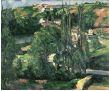
La côte de Jalais à Pontoise , 1879-1881