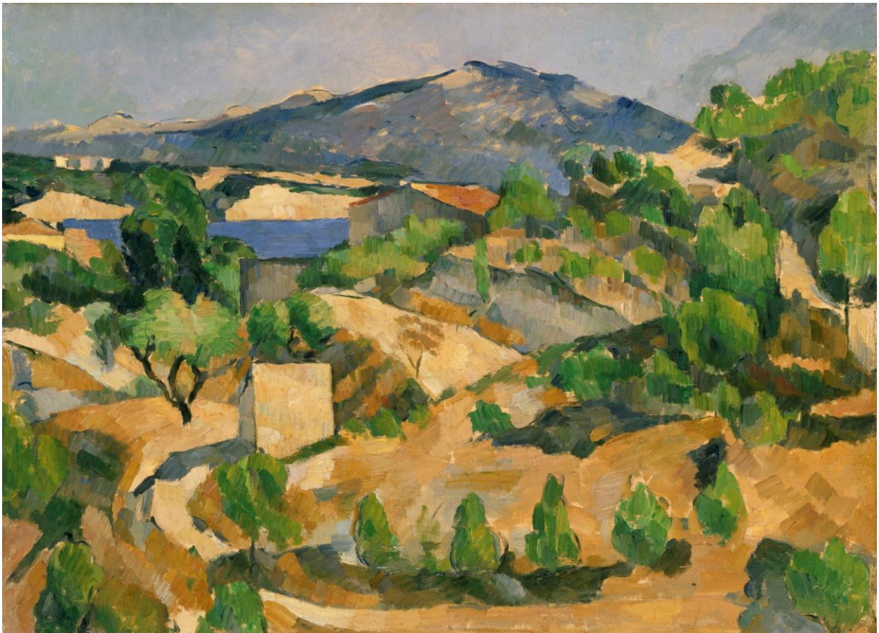
Montagnes en Provence / Le Barrage de François Zola , vers 1879