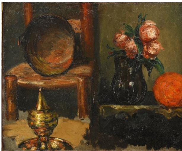
Objets en cuivre et vase de fleurs , années 1860 H.T. 39 x 46.5 cm - Fondation Pierre Gianadda, Martigny

Bientôt marqué par la découverte des œuvres d'Eugène Delacroix et de Gustave Courbet, lors de ses différents séjours à Paris en 1861 et 1863, Cézanne adopte une facture épaisse dont la palette contrastée met en relief ses motifs déployés dans ses natures-mortes ou ses paysages.