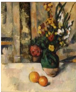
Le Vase de fleurs et pommes , 1889-1906