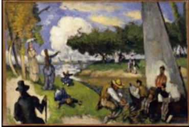
Les Pêcheurs – Journée de juillet , vers 1875 Huile sur toile, 54,5 x 81,5 cm The Metropolitan Museum of Art, New York