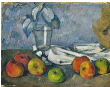
Verre et pommes , 1879-1880