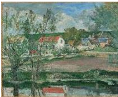
Paysage au bord de l'Oise, le Valhermeil , 1873-1874

Huile sur toile, 42 x 55 cm, Promised gift from a private collector