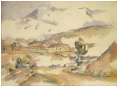
La montagne Sainte-Victoire vue du Pont de Bayeux à Meyreuil , vers 1887