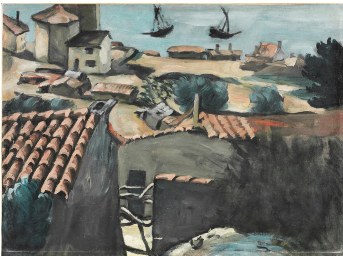
Le Village des pêcheurs à l'Estaque , 1867-1869 (1870) H.T. 42 x 55 cm - Philadelphia Museum of Art, (promised gift).

Après ses années de formation, Cézanne offre avec Le Village de pêcheurs à l'Estaque , une perspective, un éclat et un traitement de l'espace radicalement différents.