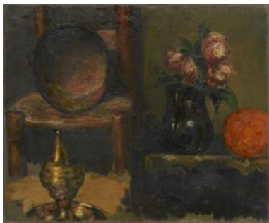
Objets en cuivre et vase de fleurs , années 1860