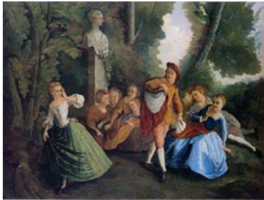
Le Jeu de cache-cache, d'après Lancret , 1862-64

Huile sur toile, 165 x 218 cm Nakata Museum , Hiroshima