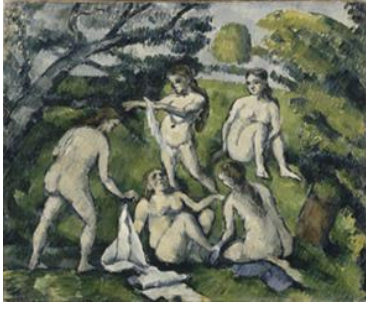
Cinq Baigneuses, 1877-1878 Huile sur toile, 45,5 x 55 cm Musée National Picasso, Paris. Donation en 1873, RF 1973-61