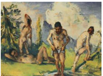
Les Baigneurs au repos, vers 1875-1876 Huile sur toile 38 x 45.8 cm Musée d'art et d'histoire de la Ville de Genève, Dépôt de la Fondation Jean-Louis Provost