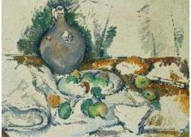
Nature morte à la cruche , 1893 Huile sur toile, 53 x 71 cm Tate, Bequeathed by C. Frank Stoop 1933