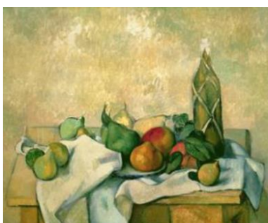
Bouteille de liqueur , vers 1890