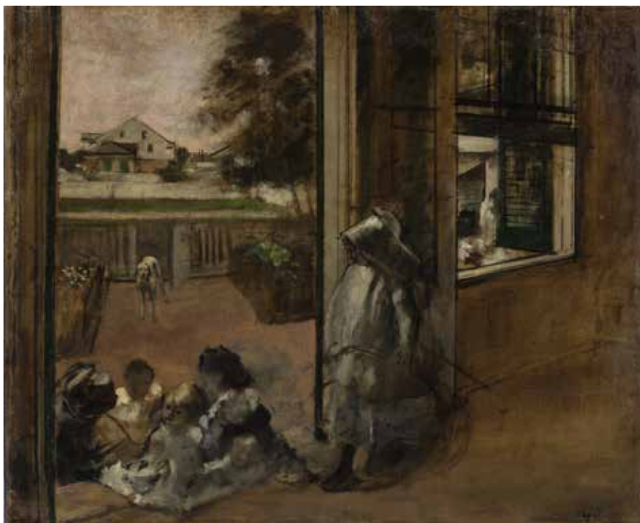
Edgar Degas « Cour d'une maison (Nouvelle-Orléans, esquisse) », 1873 Huile sur toile, 60 x 73,5 cm Ordrupgaard, Copenhague