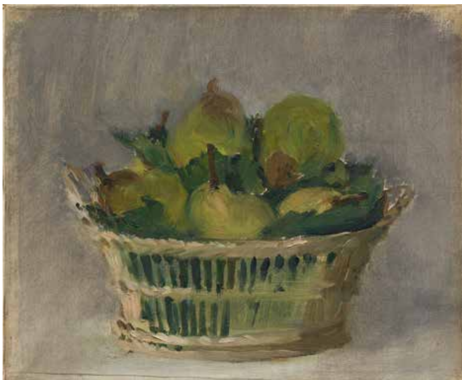
Édouard Manet Corbeille de poires , 1882 Huile sur toile, 35 x 41 cm Ordrupgaard, Copenhague