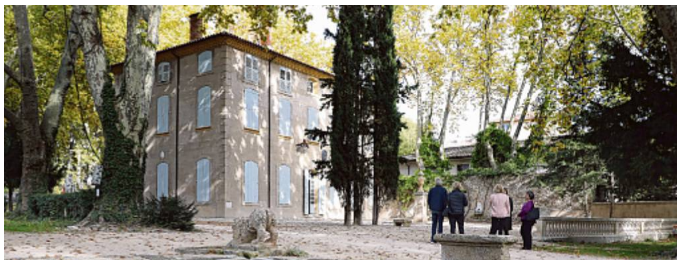
La bastide du Jas ouvrira ses portes après de longues années de travaux, elle accueillera notamment la Société Paul Cézanne.

137 millions de dollars pour une "Sainte-Victoire" signée Paul Cézanne, vendue aux enchères outre Atlantique en novembre 2022. C'est dire combien l'artiste est toujours particulièrement estimé. Alors, pour réaffirmer sa place de ville-mère du maître du post impressionnisme, Aix-en-Provence prévoit une année entière dédiée à Cézanne en 2025. Bien sûr, l'événement phare sera une exposition programmée au musée Granet avec 80 à 100 œuvres présentées. Un tour de force quand on connaît la difficulté à réunir et faire voyager des toiles aussi prisées. En 2006, Cézanne en Provence avait affolé les compteurs avec 450 000 visiteurs. Nul doute que cet événement attirera les foules des grands jours. Mais au-delà du volet artistique, pour